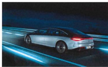
Mercedes-EQ, EQS 580 4MATIC

講演会は、大阪機械器具卸商協同組合の組合員及びメーカー会員並びに全国の全機工連会員の皆様限定といたします。